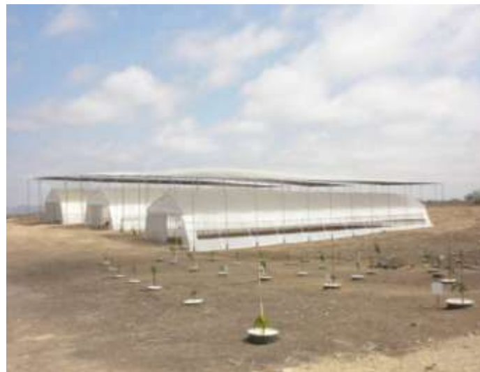
Proyecto 'Agua Vida Naturaleza', Río Verde, km 33 vía Salinas - Apartado postal 09-01-11258 - Prov. de Santa Elena - Ecuador - www.fuente-de-vida.com